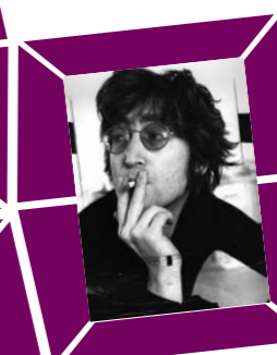
69 ALEX AGOR – JOHN LENNON, um 1970, Vintage print, Verso Papier- etikett mit Bildtext sowie Agentur- stempel, 30,5 x 21 cm, € 1200