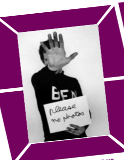
66 ANGELIKA PLATEN – PLEASE NO PHOTOS (Ben Vautier), Paris 1971 Abzug 1990er Jahre, Verso Urheberstempel, bezeichnet 12,6 x 17,7 cm, € 200