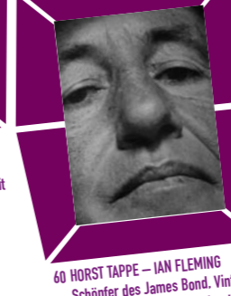
60 HORST TAPPE – IAN FLEMING Schöpfer des James Bond, Vintage print, um 1970, Verso Papieretikett mit Bildtext sowie Agenturstempel 25,2 x 21 cm, € 1000