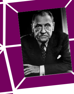
52 YOUSUF KARSH – DER SCHRIFTSTELLER Somerset Maugham, 1950er Jahre Abzug um 1970, Verso Papieretikett mit Bildtext sowie Agenturstempel 30,4 x 24 cm, € 1200