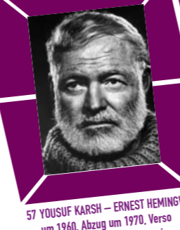
57 YOUSUF KARSH – ERNEST HEMINGWAY um 1960, Abzug um 1970, Verso Papieretikett mit Bildtext sowie Agenturstempel, 30,5 x 23 cm, € 2000