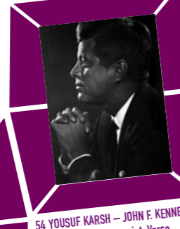
54 YOUSUF KARSH – JOHN F. KENNEDY um 1960, Vintage print, Verso Urheberstempel und Papieretikett mit Bildtext sowie Agenturstempel 30,8 x 24,2 cm, € 4000