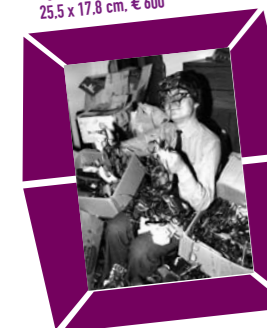
42 NILS JÖRGENSEN – DER BRILLENFREUND Vintage print, um 1977, Verso Agenturstempel mit Urheberangabe 25,5 x 17,8 cm, € 600