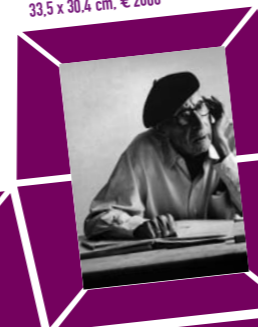
46 LORD SNOWDON (ANTHONY ARMSTRONG JONES) – PORTRÄT IGOR STRAWINSKY ZUM 88. GEBURTSTAG Vintage print 1970, Verso Papier- etikett mit Bildtext und Agenturstempel 33,5 x 30,4 cm, € 2000