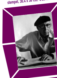
44 LORD SNOWDON (ANTHONY ARMSTRONG JONES) – PORTRÄT IGOR STRAWINSKY ZUM 88. GEBURTSTAG Vintage print 1970, Verso Papier- etikett mit Bildtext und Agentur- stempel, 30,4 x 38 cm, € 2000