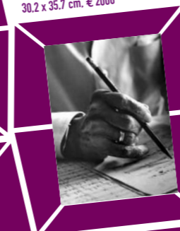
47 LORD SNOWDON (ANTHONY ARMSTRONG JONES) – DIE HÄNDE VON IGOR STRAWINSKY Vintage print 1970, Verso Papieretikett mit Bildtext und und Agenturstempel 30,2 x 35,7 cm, € 2000