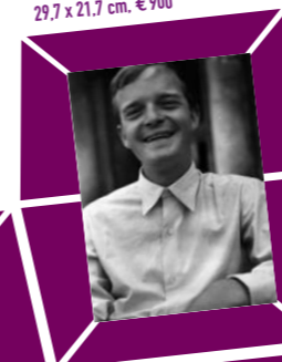
48 ANONYMER FOTOGRAF – TRUMAN CAPOTE, Venedig 1948 Vintage print, Verso Papieretikett mit Bildtext sowie Agenturstempel 29,7 x 21,7 cm, € 900