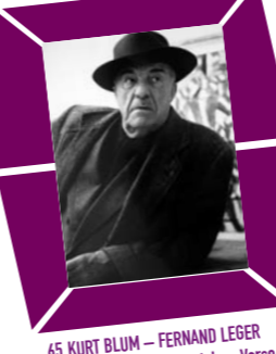
65 KURT BLUM – FERNAND LÉGER 1952, Abzug 1990er Jahre, Verso Papieretikett mit Urheberstempel, bezeichnet, 12 x 8,9 cm, € 200