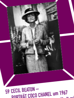
59 CECIL BEATON – PORTRÄT COCO CHANEL um 1967 Vintage print, Verso Papieretikett mit Bildtext sowie Agenturstempel 20,6 x 15,2 cm, € 1200