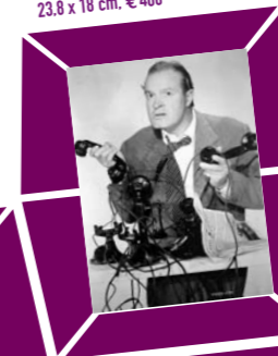
67 ANONYMER FOTOGRAF – DER KOMMUNIKATOR, USA, 1930er Jahre, Vintage print, 23,8 x 18 cm, € 400