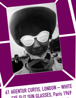
61 AGENTUR CURTIS, LONDON – WHITE EYE SLIT SUN GLASSES, Paris 1969 Vintage print, Verso Papieretikett mit Bildtext sowie Agenturstempel 30,3 x 25,5 cm, € 800