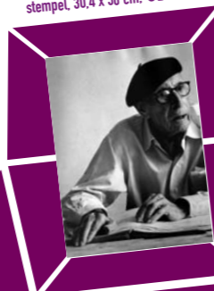
45 LORD SNOWDON (ANTHONY ARMSTRONG JONES) – PORTRÄT IGOR STRAWINSKY ZUM 88. GEBURTSTAG Vintage print 1970, Verso Papier- etikett mit Bildtext und Agentur- stempel, 30,4 x 38 cm, € 2000