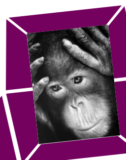
70 TONI ANGERMAYER – JUNGER ORANG UTAN Vintage print, um 1960, Verso Urheberstempel, 23,918 cm, € 500