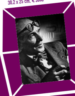
51 YOUSUF KARSH – LE CORBUSIER 1950er Jahre, Abzug um 1970, Verso Papieretikett mit Bildtext sowie Agenturstempel 30,2 x 25 cm, € 3000